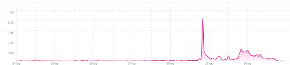
MENTIONI NEL TEMPO