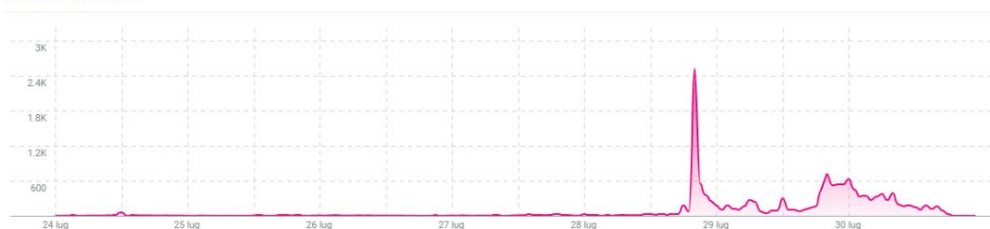
MENZIONI NEL TEMPO