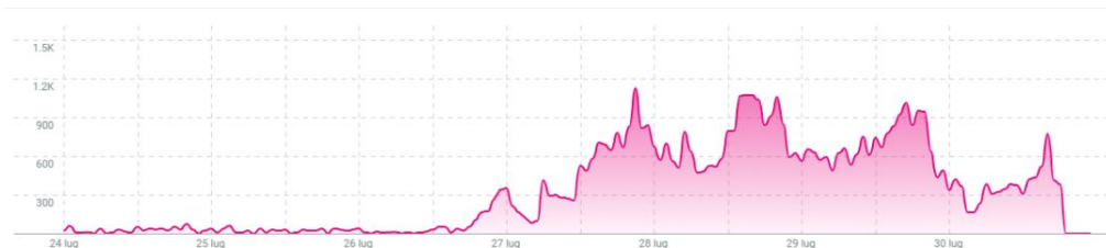
MENTIONI NEL TEMPO